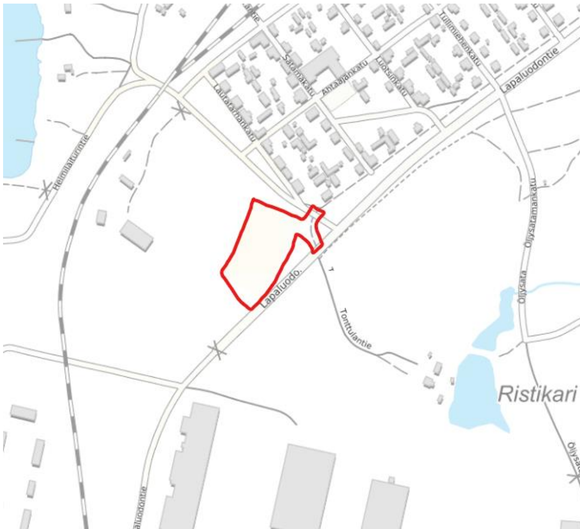
Kuva 1. Suunnittelualue taustakartalla.

Suunnittelualue sijaitsee Raahen Lapaluodossa. Suunnittelualue rajautuu lounaasta Raahen satamaan ja koillisesta Helmilaiturintiehen. Alueella on voimassa asemakaava Akm-0208 (voimaantulo pvm. 28.1.2013).