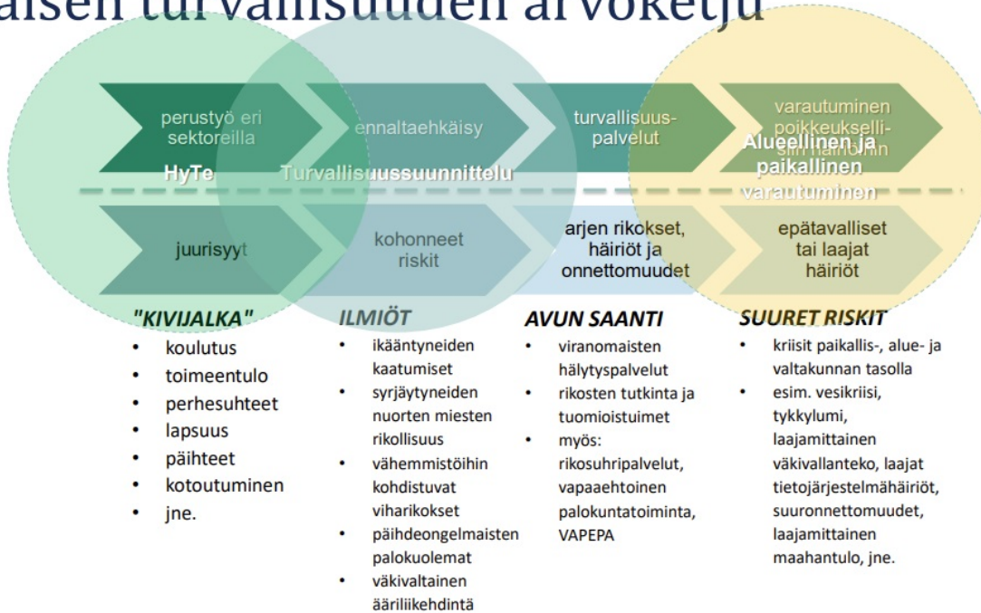
Kuva1 Sisäisen turvallisuuden arvoketju