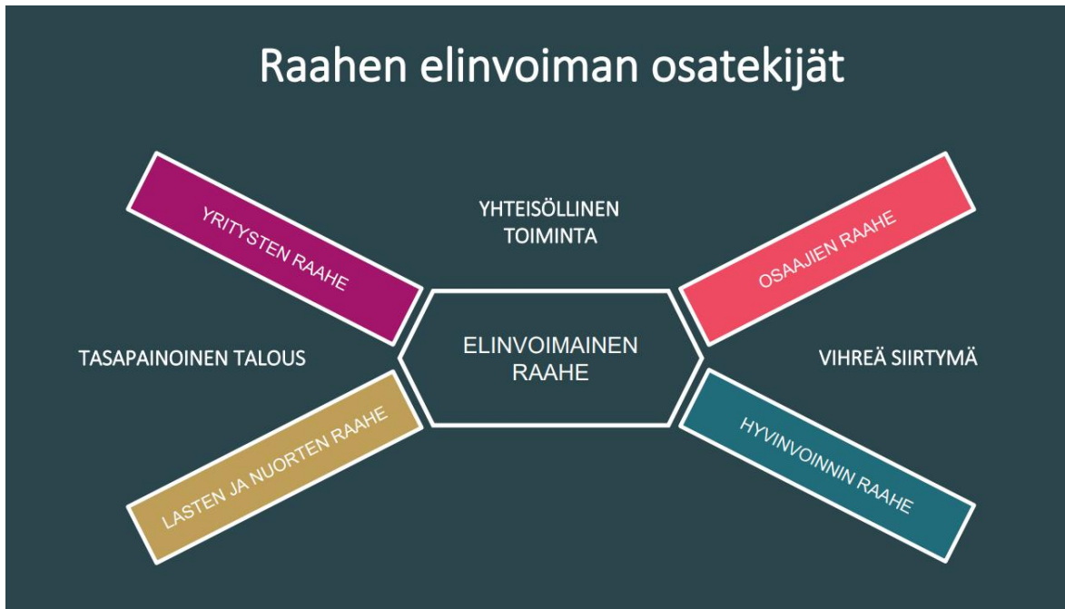
Kuva 1. Raahen kaupunkistrategian elinvoiman osatekijät.