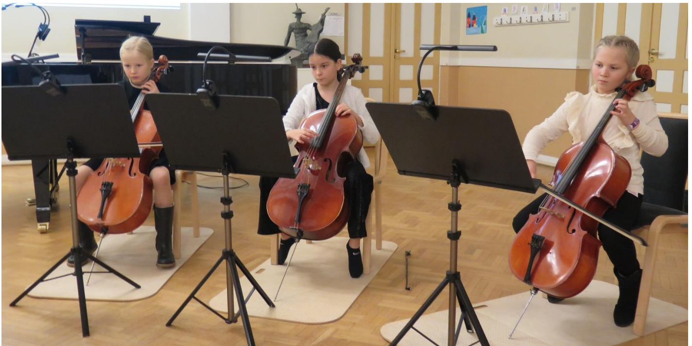
Sellotrion yhteismusisoinnin iloa.

Musiikin esittäminen on olennainen osa opintoja. Opetuksessa hyödynnetään musiikkiopiston konserttitilaisuuksien lisäksi lasten ja nuorten normaaliin elämänpiiriin kuuluvia esiintymismahdollisuuksia kodeissa, kouluilla ja seurakuntien tilaisuuksissa. Instrumenttiopintojen opintosuoritukset toteutetaan oppilaitoksen musiikkituokioissa ja konserteissa.