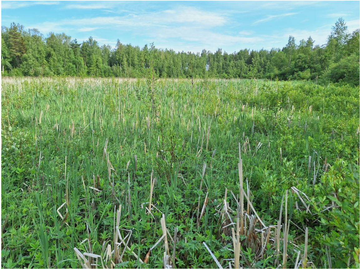
Kuva 1. Satamajärvi on lähes umpeenkasvanut.