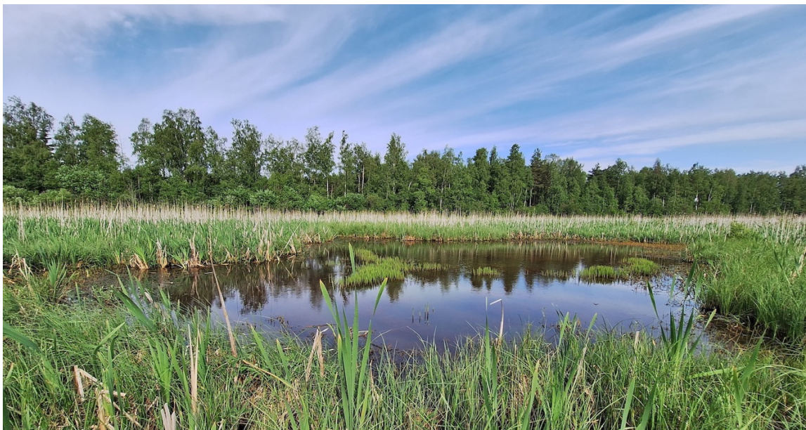
Kuva 2. Satamajärven keskiosilla on pieni avovesialue.