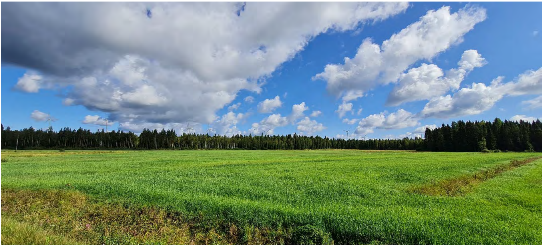
Kuva 9. Valokuva Pelkosperän pelloilta kohti Nikkarinkaarron laajennusalueita. Etäisyys laajennusalueelle on noin 2 km.