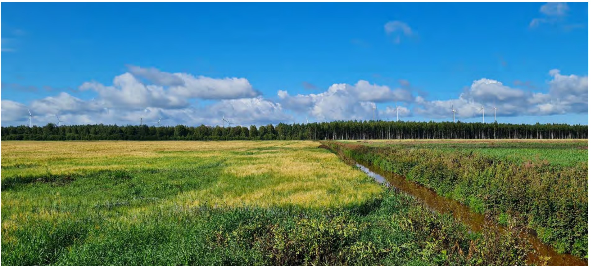
Kuva 5. Valokuvasovite Rakeenperän pellolta länteen. Etäisyys laajennusalueelle on noin 3 kilometriä.