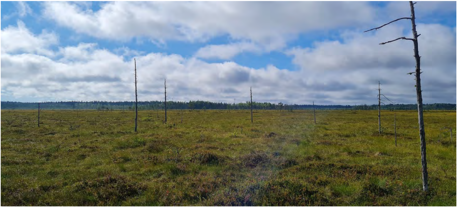
Kuva 2. Valokuva Pitkäsnevan suoalueelta kohti Nikkarinkaarron laajennusalueetta. Horisontissa näkyy Nikkarinkaarto I-tuulivoimapuiston tuulivoimaloita. Etäisyys Nikkarinkaarto I-tuulivoimapuistoalueelle on noin 4-4,5 km.