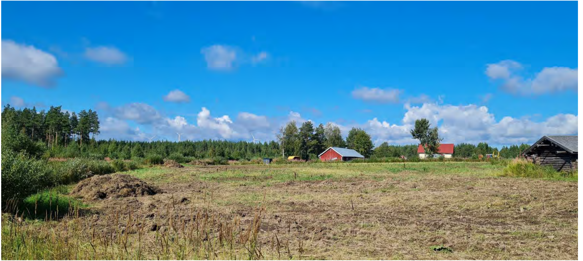
Kuva 6. Valokuva Rakeenperän pelloilta, Salolantien varrelta länteen. Horisontissa näkyy Nikkarinkaarto I-tuulivoimapuiston tuulivoimaloita. Etäisyys Nikkarinkaarto I-tuulivoimapuistoalueelle on noin 2-2,5 km.