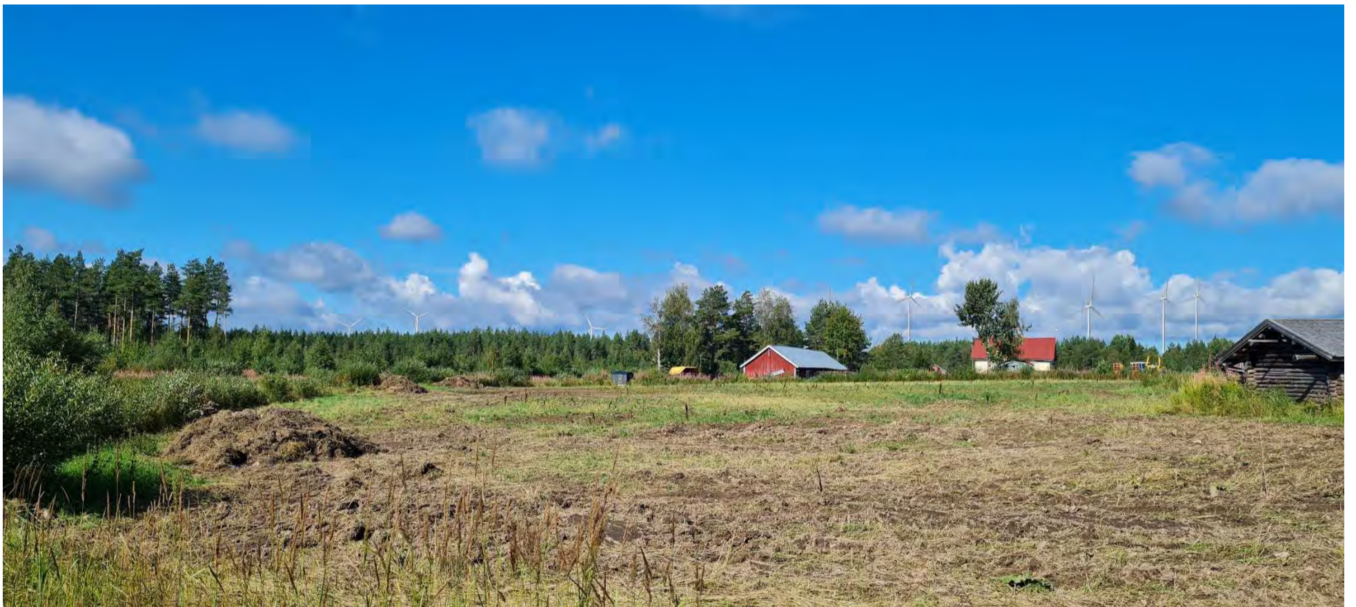
Kuva 7. Valokuvasekvenssi Rakeenperän pelloilta, Salolantien varrelta länteen. Etäisyys laajennusalueelle on noin 3-3,5 km.